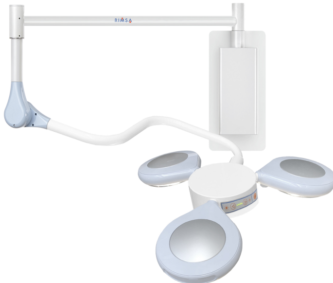
Lampa operacyjna jezdna Quattroluci