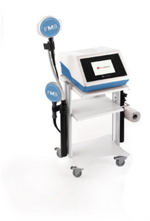
Wózek pod aparat FMS (1600883)