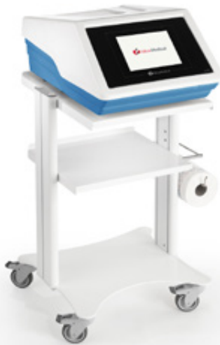
Wózek pod aparat FMS (1600879)