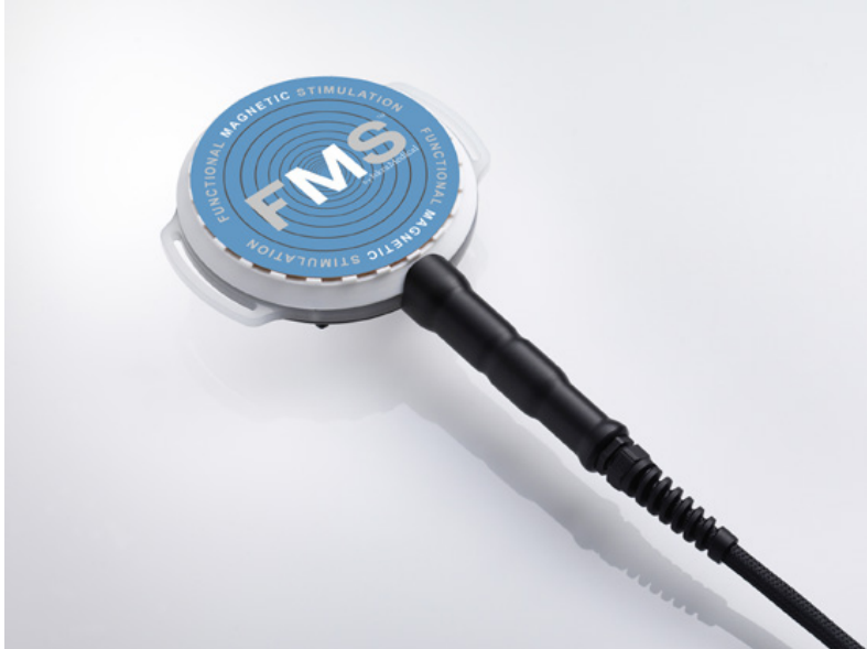
Aplikator podłużny FMS4 M (15113057) - kolor niebieski