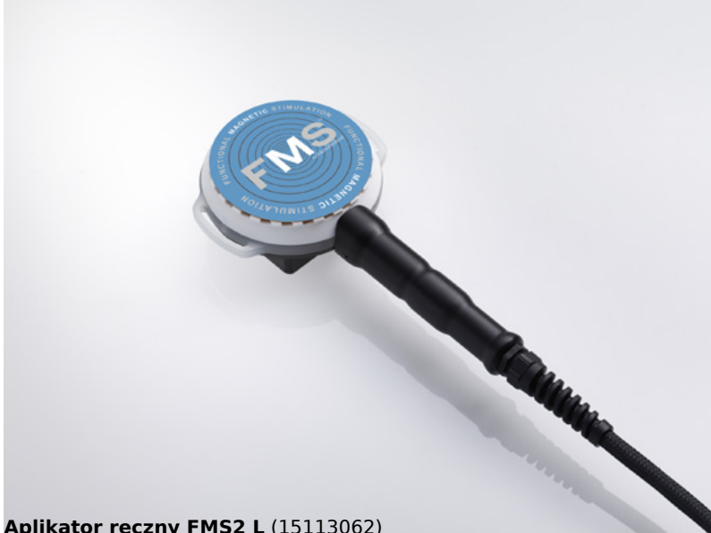
Aplikator ręczny FMS2 L (15113062)